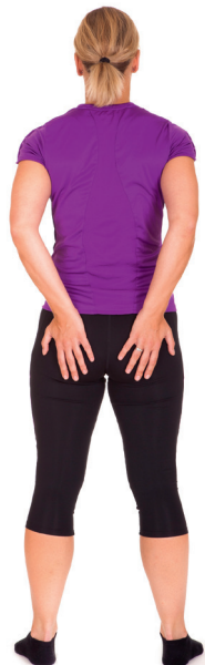
Stående med avspente setemuskler.

1. Hold hver sammentrekning 6-8 sekunder. Hvis dette er vanskelig til å begynne med, starter du med kortere holdetid og øker til det optimale etter hvert. Øk antall repetisjoner gradvis til du klarer 8-12 repetisjoner. Gjør tre serier daglig. Som en progresjon til treningen kan du gjøre tre raske sammentrekninger på slutten av holdetiden. Du kan enten gjøre tre serier etter hverandre med en liten pause mellom hver serie, eller du kan fordele seriene utover dagen. Gjør det som gir best kvalitet, og som passer best inn i din arbeids- og livssituasjon.