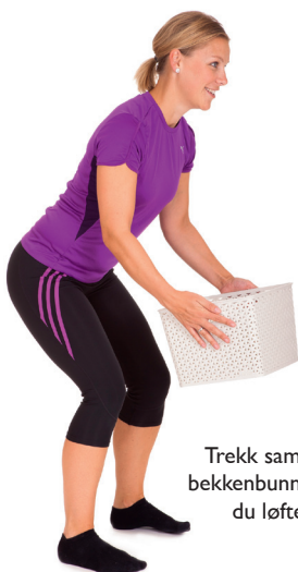
Trekk sammen bekkenbunnen før du løfter.

2. Trekk sammen bekkenbunnen i forkant av aktiviteter som gir økt buktrykk og fare for potensiell lekkasje (for eksempel løft, hoste, nys, hopp, løp, sit-ups).